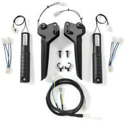
HANDTAGSVÄRME-SATS 599 42 39-01