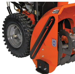
VALLSKÄRARE, SATS 532 18 36-14