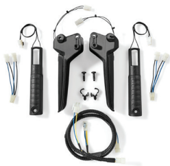
HANDTAGSVÄRME-SATS 599 42 39-01