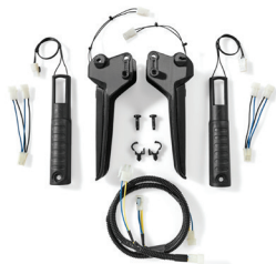
HANDTAGSVÄRME-SATS 599 42 39-01