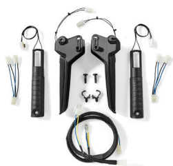
HANDTAGSVÄRME-SATS 599 42 39-01